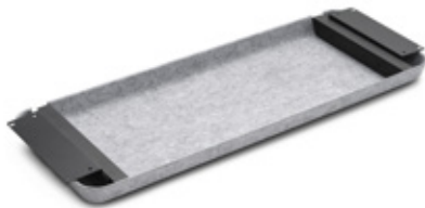
6000-0192-0038 Light Grey