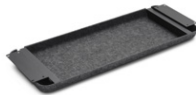
6000-0192-9000 Dark Grey